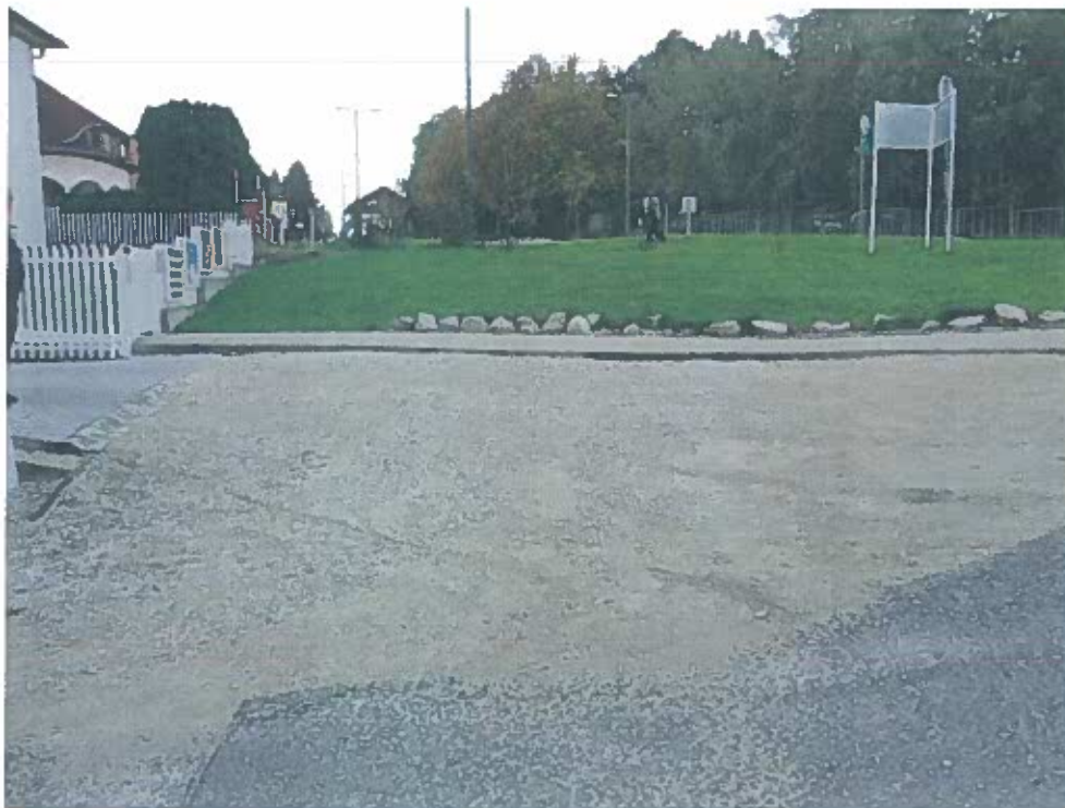
JELENLEGI KAVICSOS BEJÁRAT