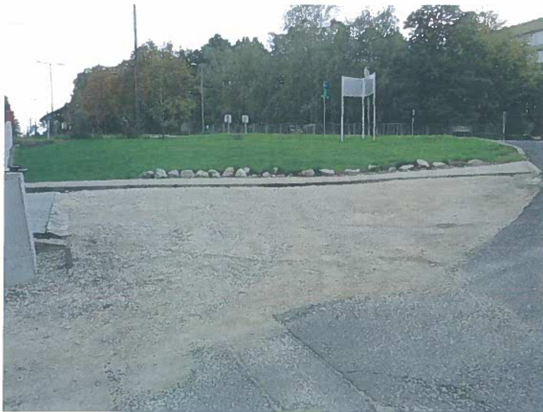
RÓMAI UTCA FELÖLI NÉZET