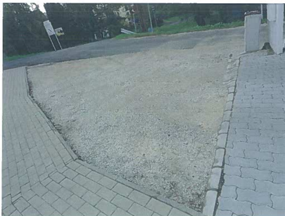
ENGEDÉLYEZETT KÖZTERÜLETI GYALOGJÁRDA