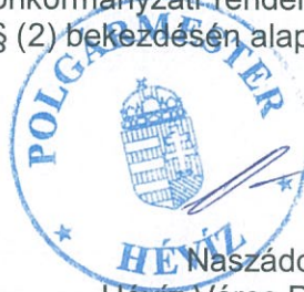
Naszáros Péter Hévíz Város Polgármestere