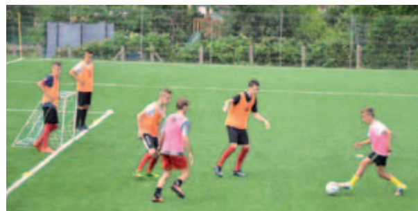
Exkluzív tábor, tehetséges csatárokkal

– Elsősorban a szakmai munkáról szólt a tábor, másodsorban pedig a gyönyörű környezetet és a Hévíz adta lehetőségeket is kihasználtuk. Először is beazonosítottuk a karaktert, minden gyermeket egyéni diagnosztizáltunk, ezáltal feltérképeztük az erősségeiket, utána tudatosítottuk bennük, hogy mik ezek. Majd a hatékonyságot úgy fejlesztettük, hogy jól időzítsenek, s az erősségeiket a megfelelő időben és helyen hasznosítsák. (ta)