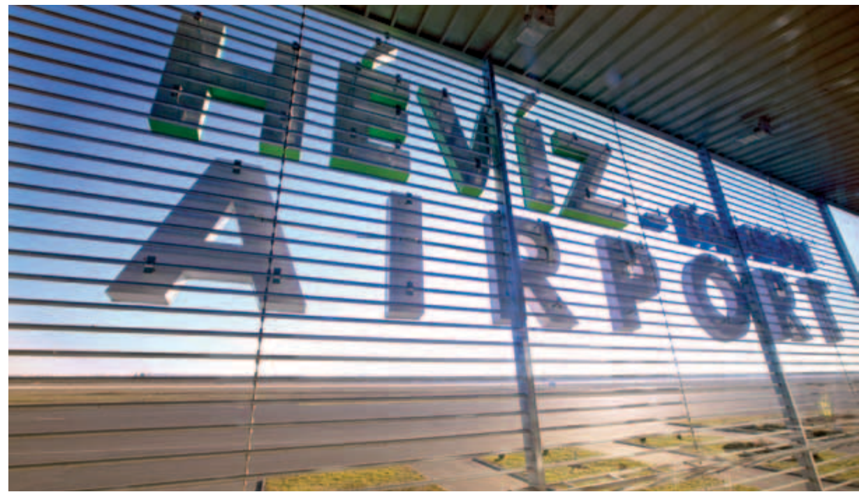
Az önkormányzat régóta várta már egy, a sármelléki repteret fejlesztő tőkeerős szakmai befektető jelentkezését