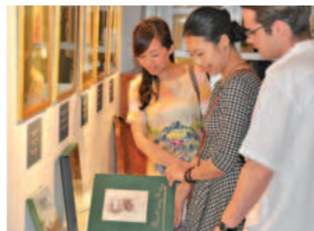
A vendégek megnézték a Munkácsy-tárlatot a Muzeális Gyűjteményben

gármester, megjegyezve: a találkozáson kiderült, hogy a jellemzően villámlátogatásokról híres kínaiak kezdenek rájönni arra, hogy a hévízi gyógyászat miatt az itteni látogatást minimálisan 5–6 napra kell tervezni. S mivel a kínai mellett a hagyományos orvoslás is érdekli őket, magyar orvosdelegációkat is szívesen fogadnának.