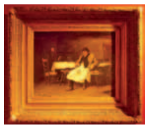
Munkácsy, a festőfejedelem

A városvezető elmondta: egyedülálló módon ezen a napon indul útjára a keszthelyi kikötőből a Hévíz névleges része lesz a helybeli és környékbeli tehetségeket felvonultató Hévízi Dalfesz-