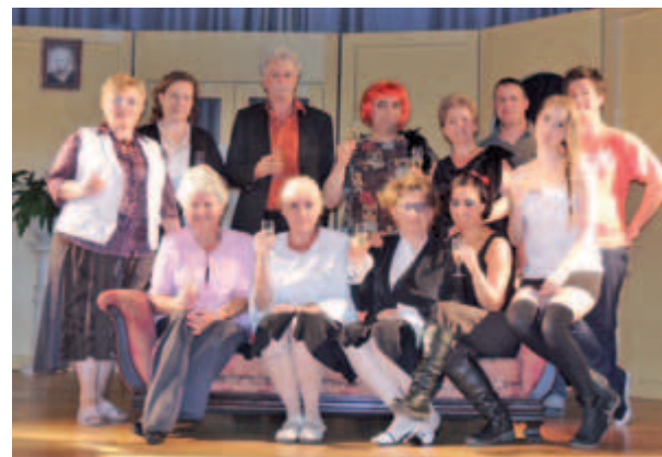
Sikert arattak Alsópáhokon is

A senior csoport kapott még felkérést Nemesbükről, Cserszegtomajról, Balatonszentgyörgyről – ezekkel a helyszínekkel most egyeztetik az időpontot. A darabot mindenképpen szeretnék még egy évig életben tartani, s emiatt folyamatosan próbálnak és gyakorolnak. A szereplőgárdában lesznek kisebb változások, mivel a fiatal lányokat játszó hölgyek közül van, aki érettségizni fog, s van, aki munkába áll.