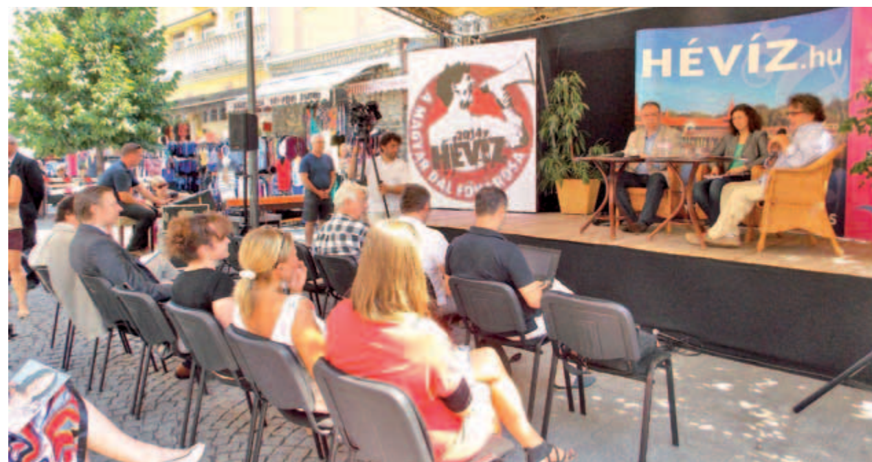
Rendhagyó helyszínen, a sétálóutcában felállított Média porondon tartották a Magyar Dal Napja sajtótájékoztatót

– Öt éve, rögtön az elején leszögeztük, hogy ez egy politikamentes rendezvény, hiszen a magyar dal mindannyiunké, és ez a nap a zene örömeinek, saját kultúránk és kincsestárunk megünneplésének a napja – fogalmazott Presser Gábor, aki elmondta még: szeptember 14-én számos hazai település kapcsolódik be a rendezvénybe, szimbolikus testvérvárosként pedig Kassa is csatlakozik a program-sorozathoz. Martonvásáron ekkor rendezik meg első alkalommal a Magyar Népdal Napját, a Vigaszínházban pedig első világháborús katonadalok szólnak majd, de