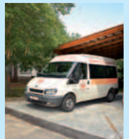
Az új csapatszallító kocsi