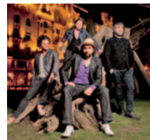
Magna Cum Laude