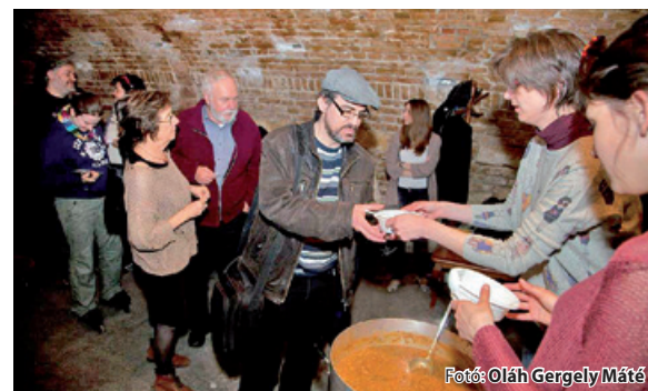
Egy étel a római szakácskönyvből: a parmezános lencse is bejött