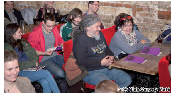
Ismét sokan voltak a fővárosi bemutatón

A húsvét utáni első napon tartották a Hévíz folyóirat új számának budapesti bemutatóját. A ferencvárosi Élesztő színpadán, mintegy hetven-nyolcvan érdeklődő előtt, az aktuális szám szerzői, interjúalanyai váltották egymást.