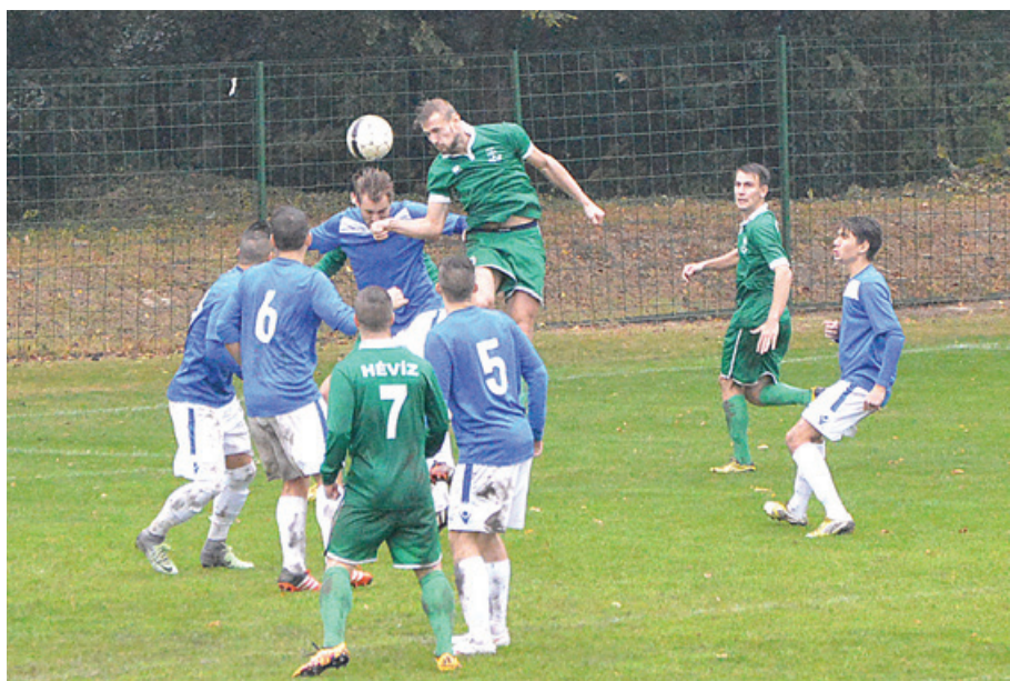
A zöld-fehérek célja, hogy megőrizzék NB III-as tagságukat. Ehhez az őszinél több pontra lesz szükségük.

– Az utánpótlás viszont kifejezetten eredményes, a felnőtteknél viszont még akad tennivaló, hogy a csapat tavasszal biztosítsa NB III-as tagságát.