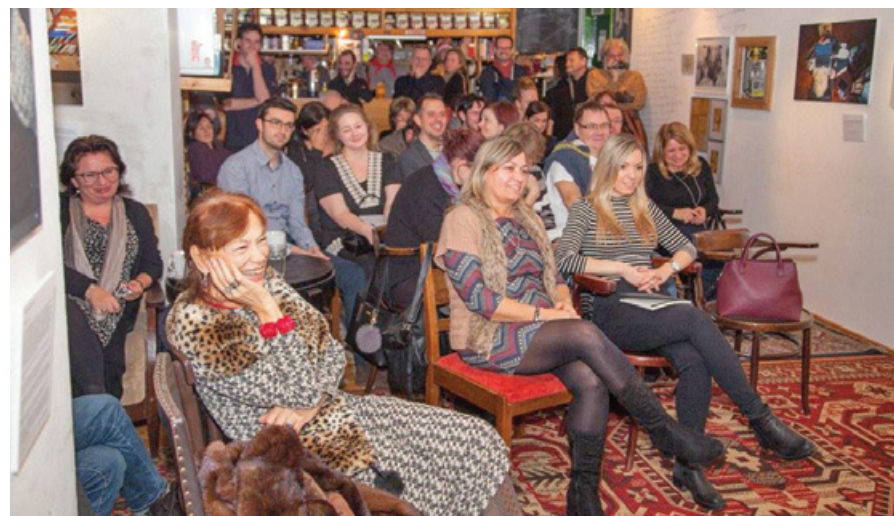
Ahogy szokott... A Hévíz folyóira Pesten is kíváncsiak