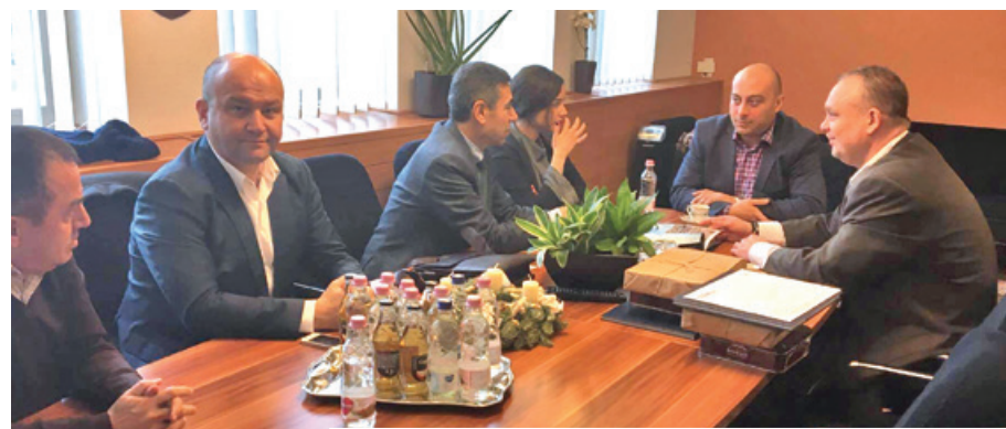
Hévíz polgármesteri hivatala múlt hétfőn nemzetközi találkozóknak adott otthont

Egy pályázati együttműködés kapcsán pedig az ausztriai Dél-burgenlandi Tartomány turisztikáért felelős szervezetének veze-