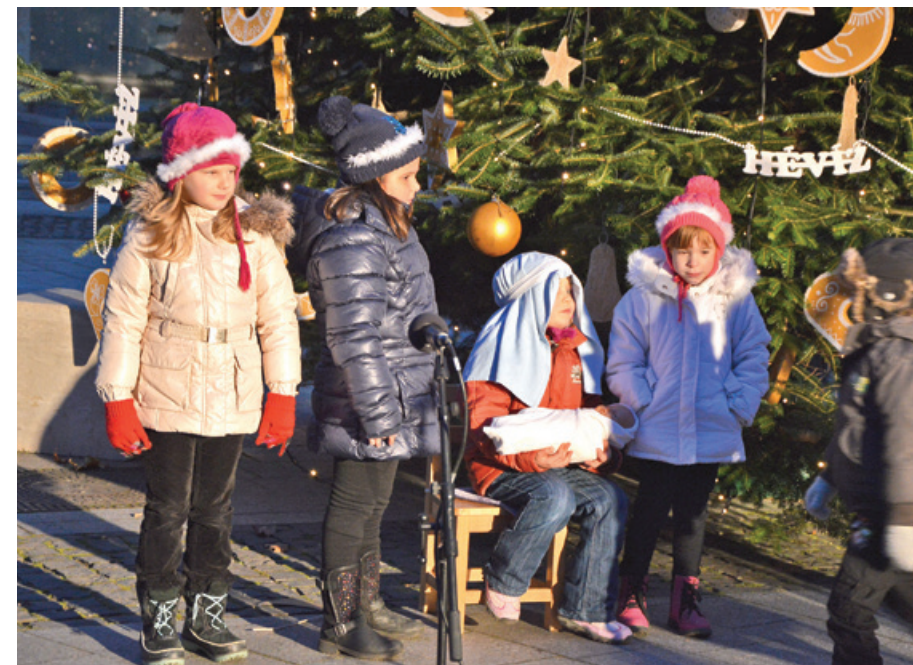
Fent az óvodások műsora, jobbra gyerekek a cipősdobozokba rejtett ajándékokkal

– Krisztus lakjék szívetekben a hit által. A szeretetben meggyökerezve és megalapozva képesek legyetek látni minden szenttel együtt, mi a mélység, a hosszúság, a magasság és a szélesség. És megismerjétek Krisztus minden ismeret meghaladó szeretetét, hogy Istent minden átfogó teljességére eljussunk.