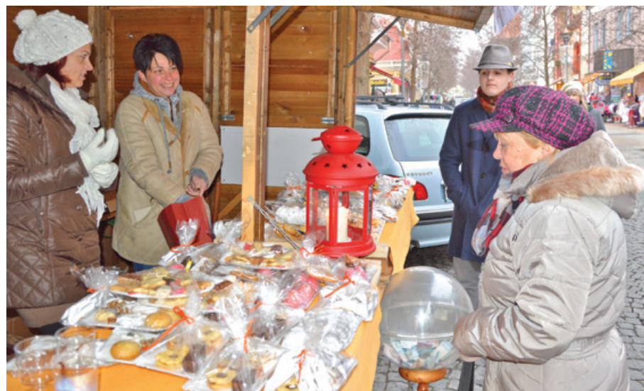
A jótékonyági süteményvásáron több mint 150 ezer forint gyűlt össze