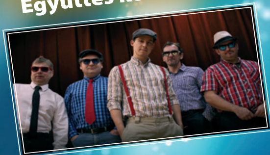
A belépés díjtalan!

január 7. szombat, 17:00 | Deák tér | Rocket Rollers Együttös koncertje