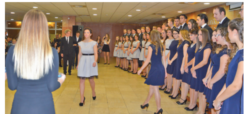
Éljetek boldogul! A diákok már az előttük álló feladatokra készülnek