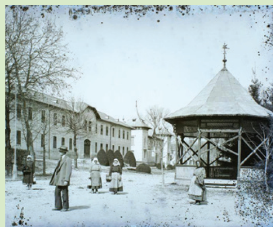
Hévízi életkép 1911-ből. A fotón a gyógyfürdő parkja, azaz a Dr. Schulhof Vilmos sétány látható, valamint a Rákóczi- és a György-ház, amely ma már a Szent András Reumakórház épülete.