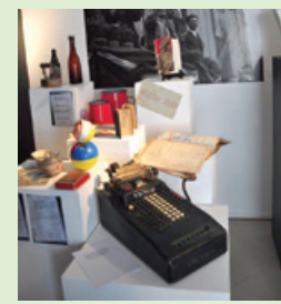
Ezernél is több tárgyi emlék látható a kiállításon

Még január 7-ig látogatható az Utunk 1956. október 23-ig című interaktív kiállítás a Belvárosi Múzeumban. A tárlat azt mutatja be, milyen volt az élet az '50-es években. Egy iskolát ismerhet meg a látogató, amit az egyházi fenntartás után államosítottak, két fiktív személy történetén keresztül pedig az iskolától eljutunk a forradalomig, majd az ÁVH rettegett börtönéig.