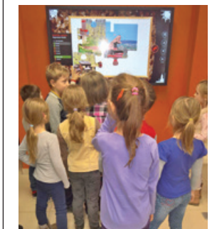
Interaktív. A gyerekek a modern technika segítségével ismerkedtek a múlttal

Az Illyés Gyula Általános és Alapfokú Művészeti Iskola első évfolyamos diákjai látogattak el a közelmúltban az egregyi múzeumba. A gyerekek, szakavatott kísérettel, végignézték az intézmény kincseit, majd kreatív foglalkozás várt rájuk, sőt extraként még a római katona sisakját is felpróbálhatták.