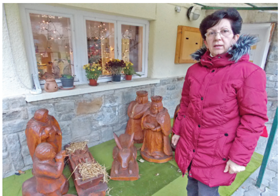
Karácsonyra készülve – az idősek klubja s a betlehem előtt