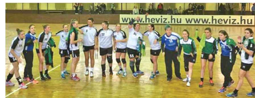
Siker siker hátán. A Hévíz előtt a Hort-Csepel is kapitulált