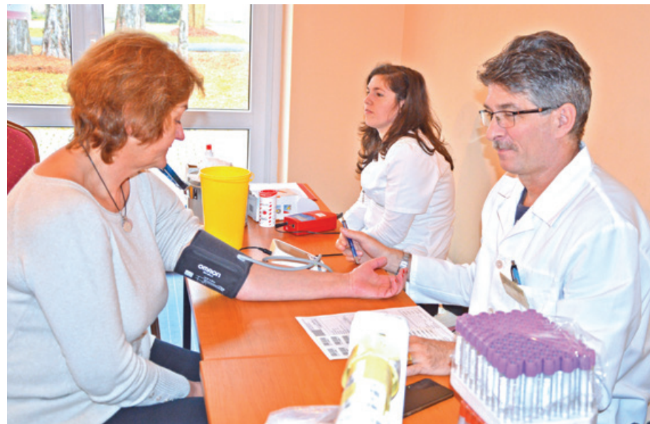
Előzetesen harmincan, zömében hévíziek jelentkeztek a véradásra