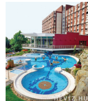
Megújultak a szálloda közösségi terei

Befejeztek a Danubius Health Spa Resort Aqua szálloda felújítási munkálatai. A közel 200 millió forintos beruházással megújultak a szálloda közösségi terei. Átépítették a bár, a hall vízvezetékjait, a gyógyászat és a liftelőtér burkolatát, illetve új látvány-