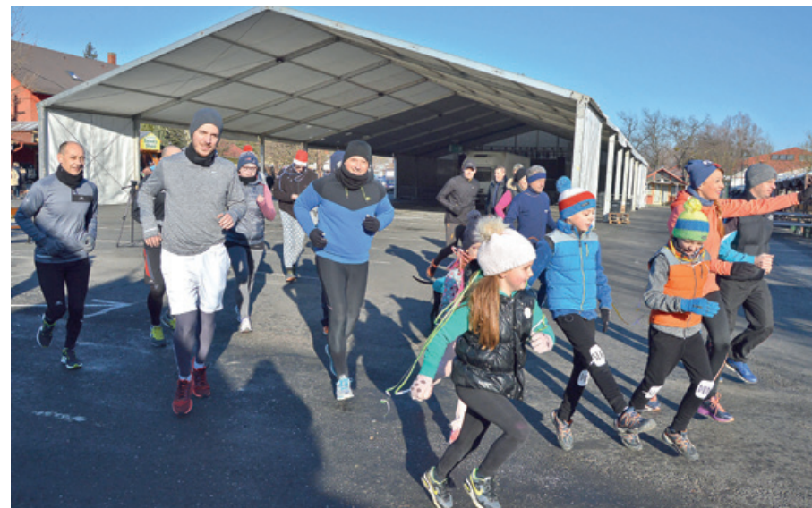
Az óév utolsó napja sem telhetett mozgás nélkül

– Ezzel a gesztussal, évzáró futással szeretnénk meg-