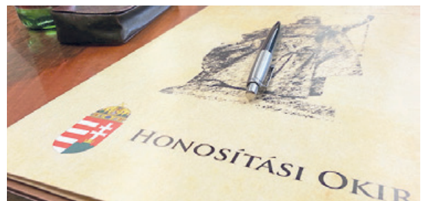
Hévízen tavalyelőtt heten, tavaly négyen tették le a magyar állampolgársági esküt, s idén januárban is volt már két honosítás