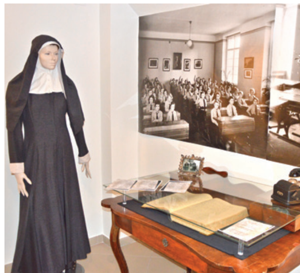
A kiállítászárón délelőtt és délután is tartottak tárlatvezetést

radalomba torkollott. Emellett Sztálin halálával a politikai életben is olyan változások történtek, hogy a sztálini és a Rákosi-rendszer tarthatatlanná vált. Az ország a Szovjetunió gazdasági és politikai felügyelete alatt állt, ez hatással volt a magyar politikai életre is, s a politikai vezetés és a gazdaság is ellehetetlenült – folytatta a helytörténész. – Mindennek a következménye volt