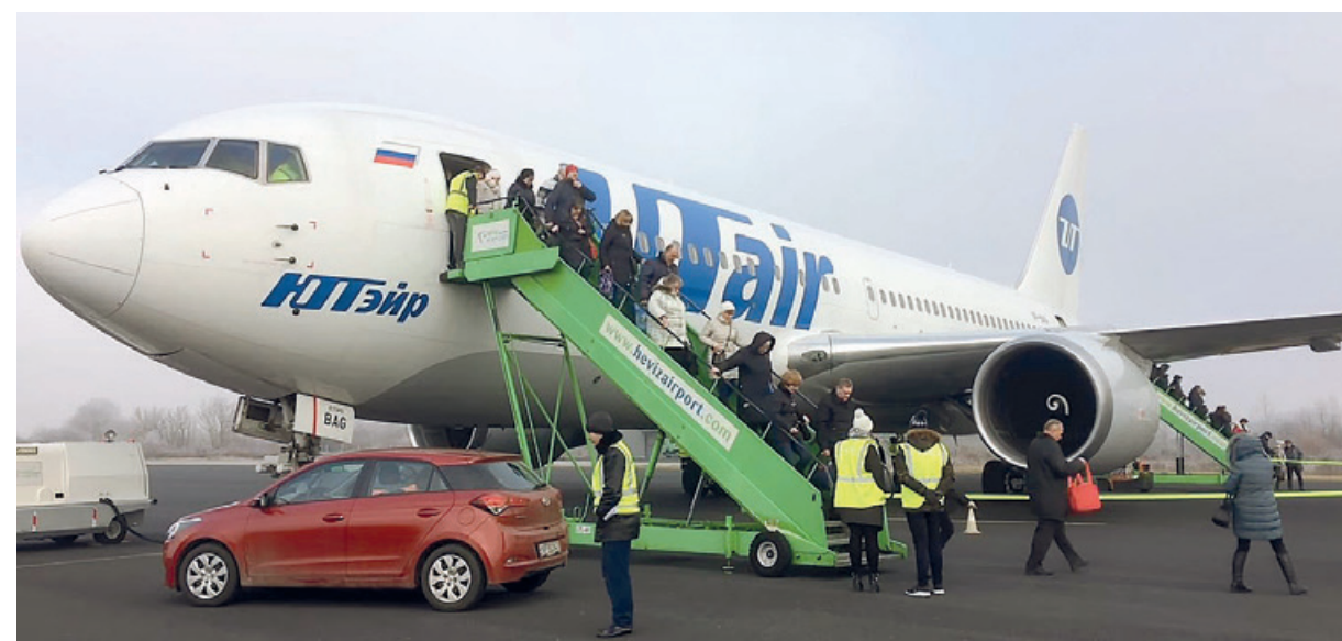
A Hévízen pihenő vendégek 27 százaléka ma már légi utasként érkezik a városba. Képünkön az egyik orosz gép landolás után