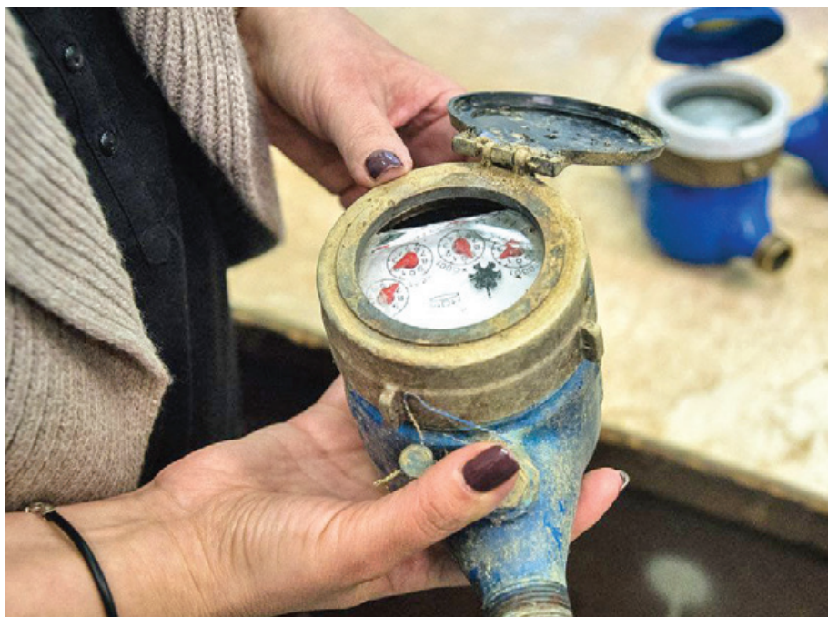
A vízmérő elfagyása odafigyeléssel megakadályozható

A vízmérőelfagyások leggyakrabban a kellő gondosság, illetve a szakszerűség hiánya miatt következnek be, mivel sokan nem fordítanak kellő figyelmet a vízmérőakna megfelelő szigetelésére, pedig néhány lépéssel jelentős anyagi kár előzhető meg, hívja fel a figyelmet a DRV.