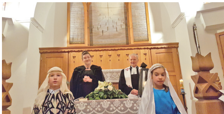
Karácsony napján, az ünnepi istentiszteleten gyerekek adtak műsort

December 25-én, karácsony első napján sokan ellátogattak a hévízi református templomba. Az ünnepi istentiszteleten gyerekek adtak műsort.