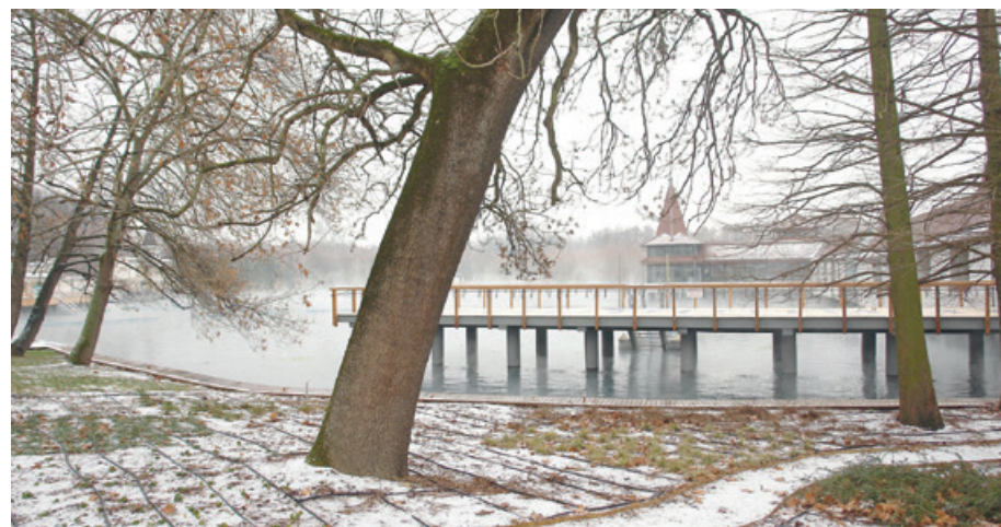
A kormányhatározatban kiemelt figyelmet szentelnek a Hévízi Tófürdő működésének átvizsgálására

A konkrétan megnevezett fejlesztési célok közül 42-t –