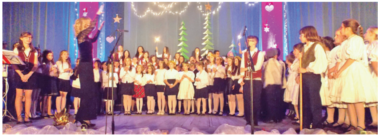
A karácsonyi koncerten az iskola aprajánagyja színpadra állt és színvonalas produkciókat adott elő