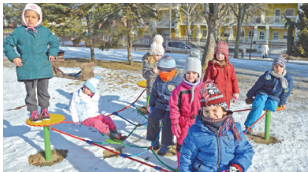
A gyerekek szívesen használják az új eszközöket