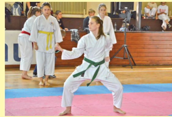
A tavalyi karateverseny sikert aratott, sokan voltak kíváncsiak a küzdelmekre