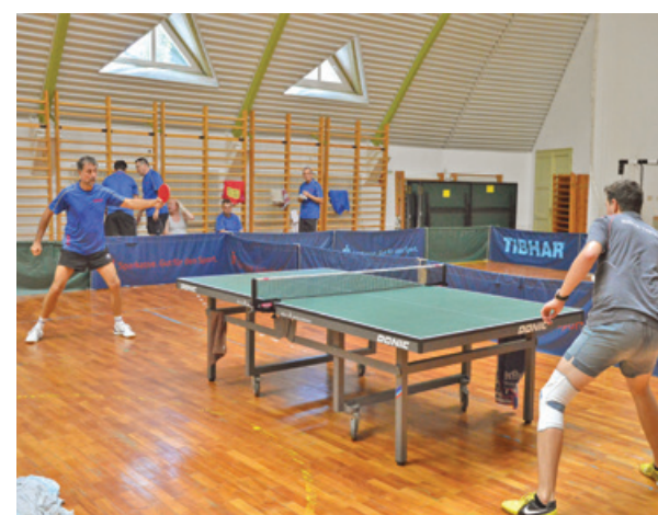
A felvétel csalóka – nem az évnitó fordulóban készült...

Az év eleji asztaliteniszrajtba belerondított a havazás. A Hévíz sem tudta vállalni az utazást a havas hétvégén.