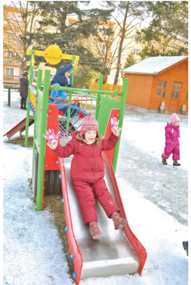
A gyerekek örömmel vették birtokba a játékokat

– Nagyon jók a fajtékok – fogalmazott –, de állandó kezelést igényelnek, mert az idő meglehetősen mostohán bánik velük. A folyamatos karbantartás ellenére is szuvasodik a fa, a nap pedig kiszáritja. Ezért néztem körül a játékpiacon, és találtam is megfelelőeket, olyanokat, amelyek egy picit visszatérnek a régi időkhöz, mivel az alapszerkezetük fém. Az anyaguk és a jó felületkezelés miatt viszont nem rozsdásodnak. (Cikkünk a 6. oldalon folytatódik.)