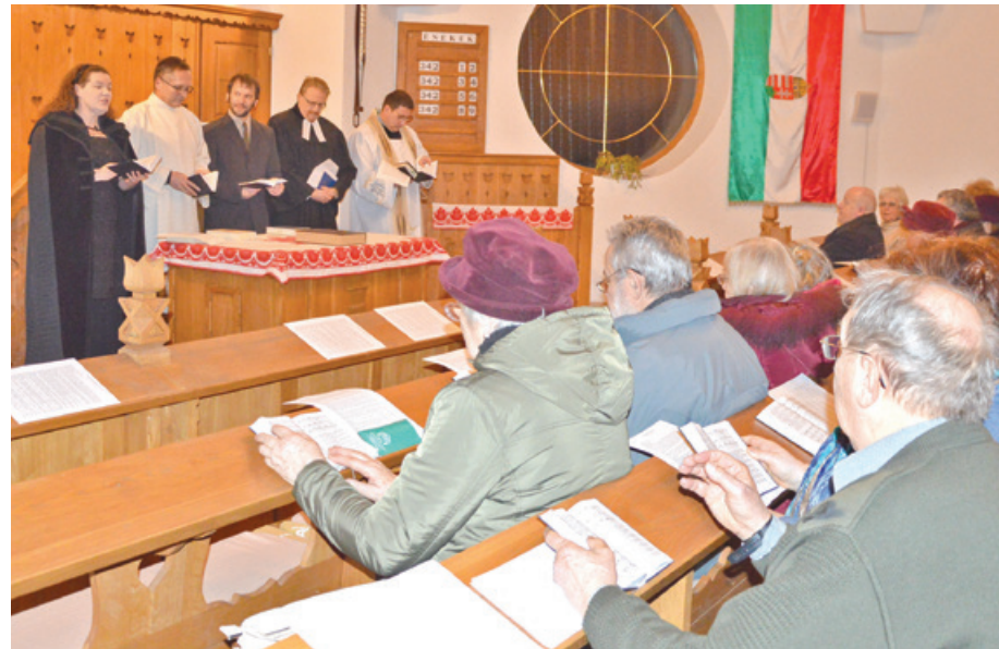
A kereszténység megerősítése különösen fontos ezekben az időkben, hangsúlyozták a lelkipásztorok

– Hiszen maga Jézus mondta, ahol ketten vagy hárman összejönnek az én nevében, ott vagyok köztük. Az idén