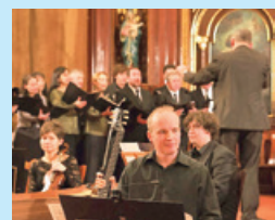
A Capella Savaria egy év végi fellépése

A szokásostól eltérően januárban a hónap utolsó csütörtökjén, azaz lapunk megjelenésével egy időben tartják a Viva la Musica komolyzenei koncertet. Január 26-án 19 órától a hévízi református templomban a világhírű szombathelyi Capella Savaria művészeinek hangversenyét hallgathatják meg az érdeklődők, tájékoztatott a