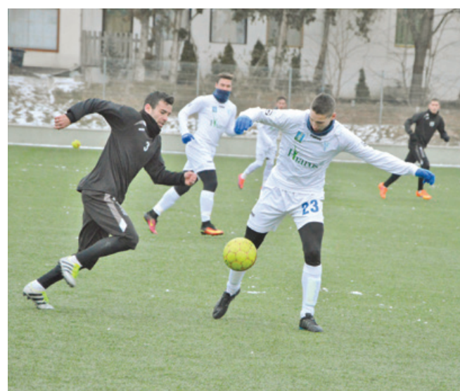
Az első edzőmeccsen a Hévíz felborította a papírfomat. Szükség lesz ilyenre a bajnoki meccseken is...