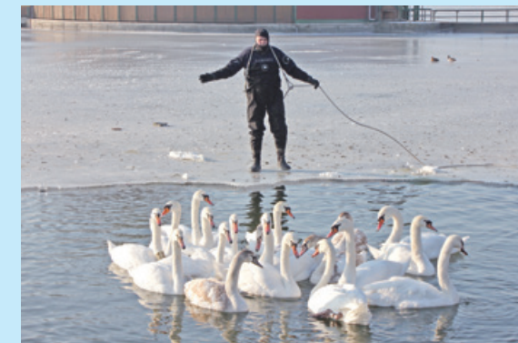
Több mint harminc hattyút fogtak be a keszthelyi Balatonparton

A napokban több mint harminc, a keszthelyi Balatonparton befogott hattyút költöztettek a hévízi lefolyóra, mert ez a víz nem fagy be, s így több táplálékhoz jutnak a madarak. Ezeknek a hattyúknak már délebbre kellene lenniük, de mivel a parton sétálók folyamatosan etetik őket, itt maradtak télire is. Ám a kapott ennyival kevés nekik, a jég miatt pedig nem férnek hozzá a táplálékhoz, így az éhhalál fenyegette őket. A mentőakcióban a Magyar Madártani Egyesület tagjainak a keszthelyi tűzoltók segítettek, s ott voltak az alsópáhoki és a balatonygyöröki önkéntes tűzoltó egyesület tagjai is.