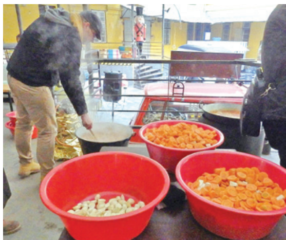
A jótékonyasági főzésen 202 adag babgulyás készült

Újabb sikeres kezdeményezés a Hévíz folyóirattól. Az alkotói közösség tagjai a Magvető Kiadó munkatársaival a fővárosi Food Truck Údvarban hajléktalannaknak főztek, s ez idő alatt ismert szerzők olvastak fel műveikből. Az érdeklődők pedig a támogató alkotók könyveinek és a Hévíz folyóirat egyes példányainak megvásárlásával adakozhattak. A teljes bevételt a hajléktalanszolgálat Budapest Bike Maffia kapta meg.