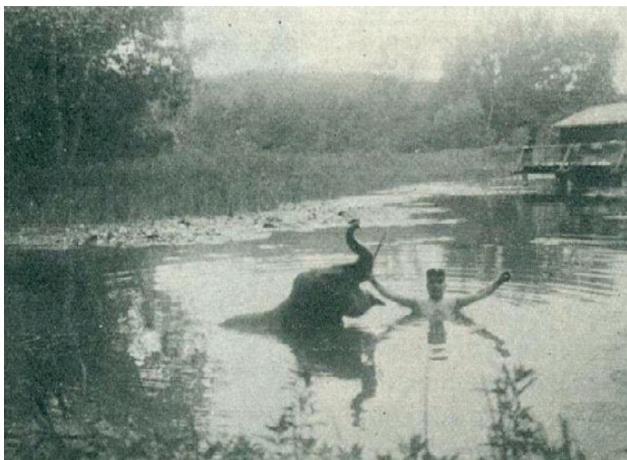
Nelly, az elefánt Hévízen gyógyult reumájából, gondozója pedig egy pillanatra sem hagyta el

1914 nyarán esett meg, hogy a fővárosi állatkert Nelly nevű ifjú elefántja gondozójával Hévízre utazott kúrátatni a fájós lábát. A korabeli képek tanúsága szerint az állat nagyszerűen érezte magát a termálvízben.