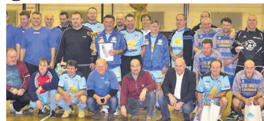
A résztvevők a fociélmény mellett a találkozás örömeért is szívesen jönnek