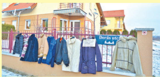
Jótékonyaság a Derús utcában: van keletje a meleg kabátoknak